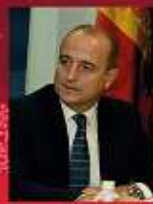
MIGUEL SEBASTIÁN GASCÓN

Exministro de Industria, Turismo y Comercio del Gobierno de España