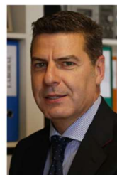
Miguel Ángel Vázquez Taín

Exministro de Industria, Turismo y Comercio del Gobierno de España