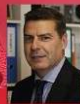
MIGUEL ÁNGEL VÁZQUEZ TAÍN

Exministro de Industria, Turismo y Comercio del Gobierno de España